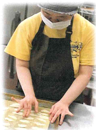
クッキー作り作業