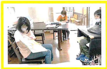
「絵本一緒に読む？」とSさん 真剣なまなざしのKさん