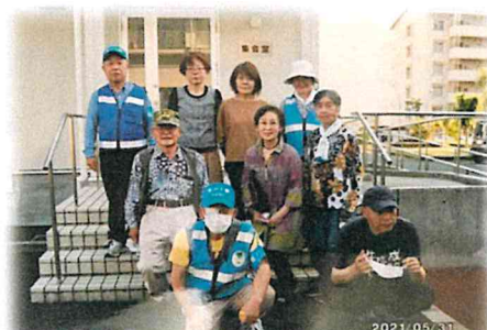
サロンの世話人の皆さん