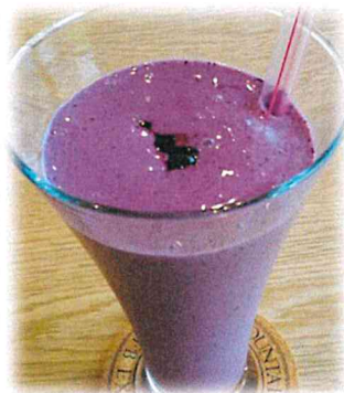
ブルーベリースムージー

畑で利用者さんが収穫した野菜等をクッキーやスムージーに使用し、事業所内喫茶店（Café 奏）にて提供しています。今の時期は夏野菜・ブルーベリーを使用した商品を販売中です！