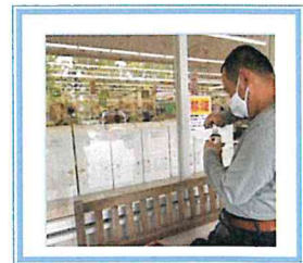
最近・・・ 健康の為に散歩を始めました。

感染対策・密を避け、健康や気分転換のための短期入所・移動支援・行動援護等で楽しみをみつけながらすごしています。