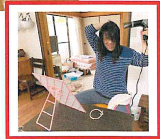
『ねえ 見て～出来ている～?』