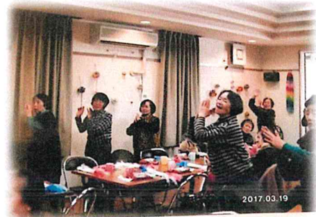
サロンの活動風景①