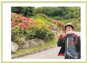
散歩の日はいつもご本人の コーディネート おしゃれー (^ー^ )y

感染対策・密を避け、健康や気分転換のための短期入所・移動支援・行動援護等で楽しみをみつけながらすごしています。