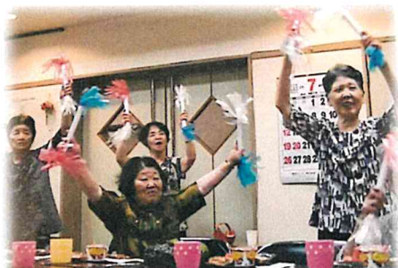
サロンの活動風景②