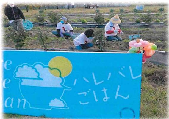
↑ 奏楽横の畑にて実施しました。