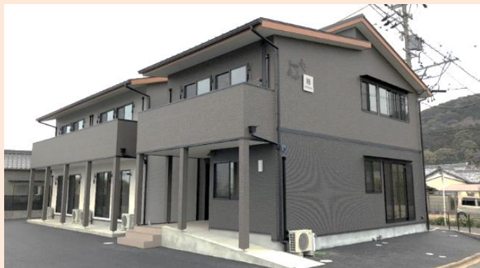
グループホーム紬 (男性 6 名 女性 4 名)