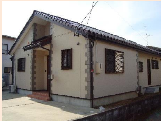
ひまわりハウス (女性 4 名)