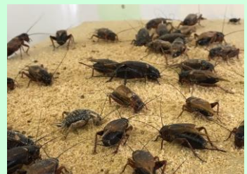
【エサ用コオロギ(成虫)】