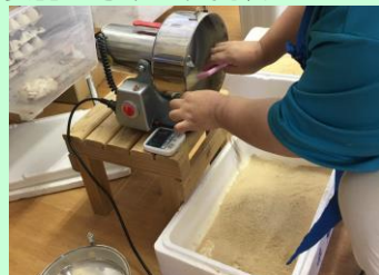
【コオロギ エサ作り】

爬虫類や小動物のエサになるコオロギの繁殖販売を行っています。コオロギの成育環境やエサ作りなど丁寧に手作業で行っています。生まれたばかりのサイズから成虫まで様々なサイズを取り扱っています。ほかにも自主製品を考案し、挑戦しています。