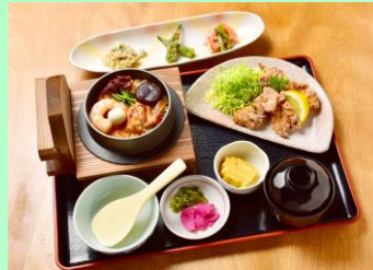
【くうの釜めしセット】

やわらかな木の温もりが感じられる店内、本格的な釜めしランチが楽しめます。定番メニューから季節限定メニューまで選びいただけます。オープンキッチンで利用者のみなさんの調理風景も楽しめます。ギャラリースペースでは、事業所内の作品展示から、地域の皆さんの作品展示も行っています。