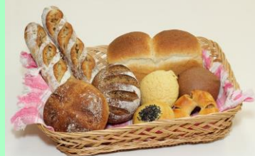
【天然酵母・国産小麦パン】

材料は無農薬有機栽培の自然の力でじっくり熟成し焼き上げたパンは、小麦の旨み、酵母の香りが感じられる素朴な味わいです。カンパーニュなど本格的なパンから、メロンパンなどの菓子パンまで豊富な種類を取り揃えています。毎月定期購入のお楽しみパンセットやイベント・バザー販売も行っています。